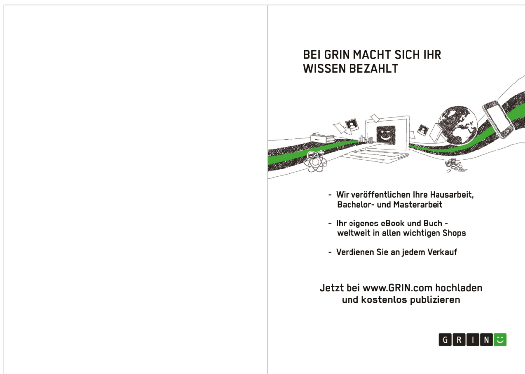
Inside of the book cover

This is how the front pages will look in your book: